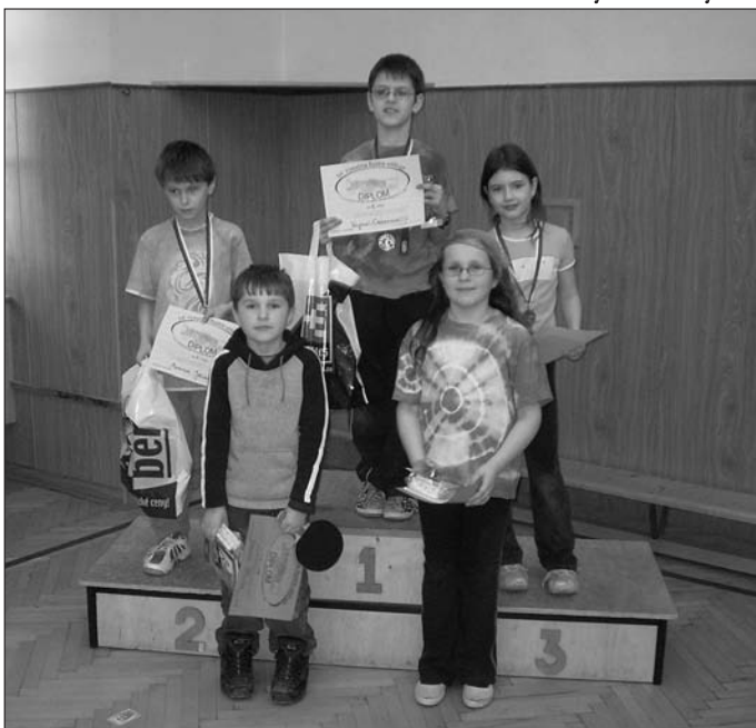
Mladší žáci na stupních vítězů