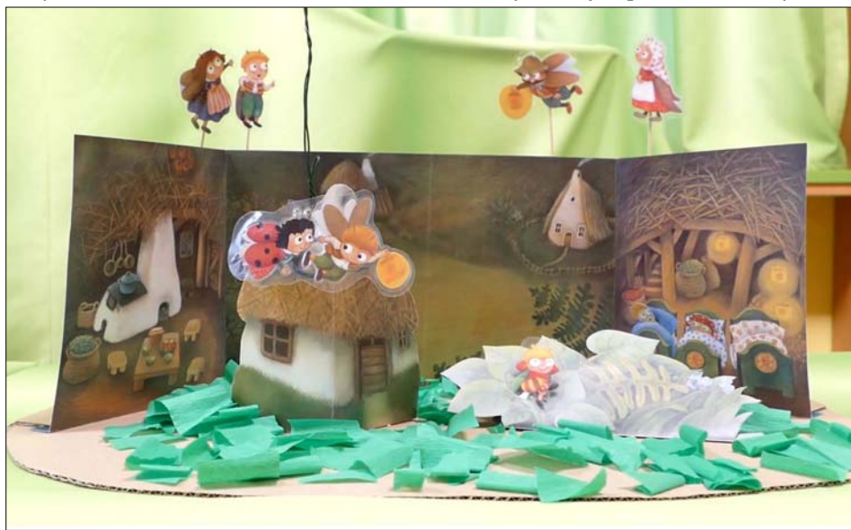
Kulisy motivačního videa – s pracovním názvem Brouček a Beruška – na rozvoj předmatematických dovedností dětí.

A co ostatní děti, které se chtějí zabavit a stýská se jim po školce? Pro tyto děti