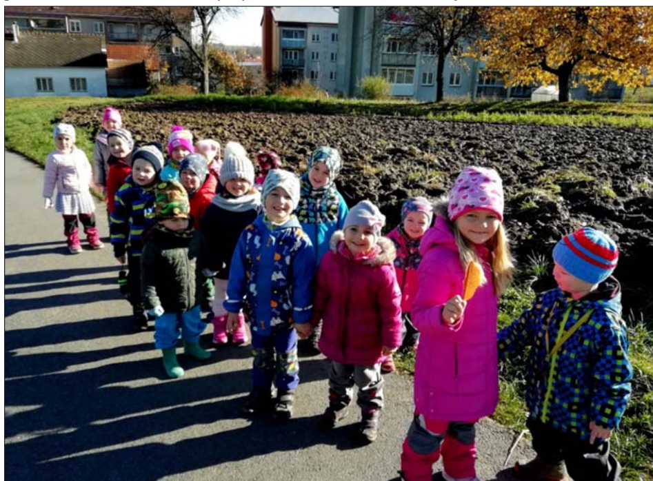
Pozorujeme krásy a proměny podzimní přírody

Jsmo rádi, že vánoční fotografování proběhlo i ve ztížených podmínkách současné situace a děkujeme všem účastníkům za