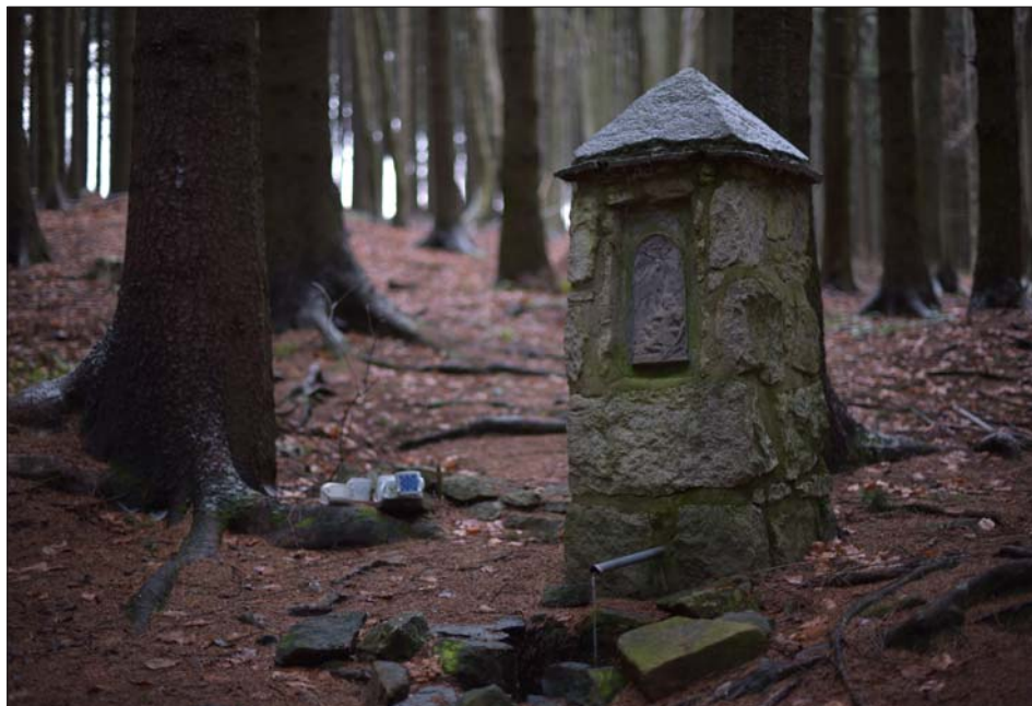
Malá ochutnávka aneb fotka, kterou v kalendáři nenajdete

O zahájení prodeje vás budeme informovat. IC