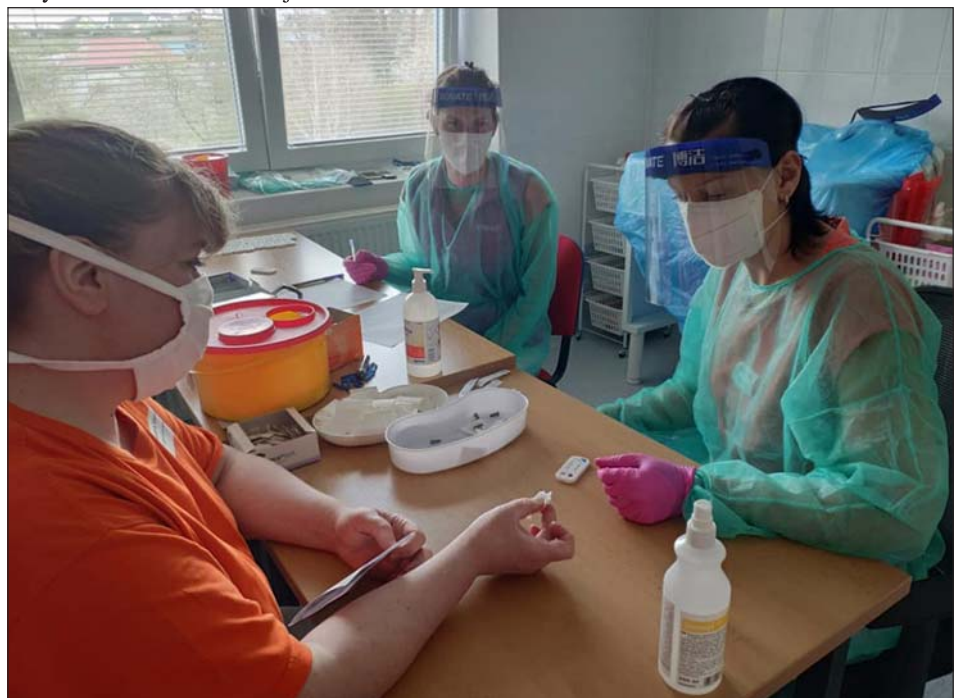
Momentka z pravidelného testování zaměstnanců na Covid 19.