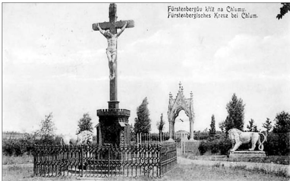
Bojiště na Chlumu - Ossarium, Fürstenberský kříž