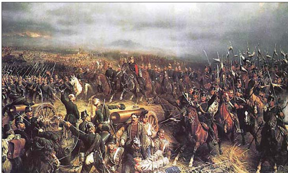
Obraz zachycující výjev z Rakousko-pruské války