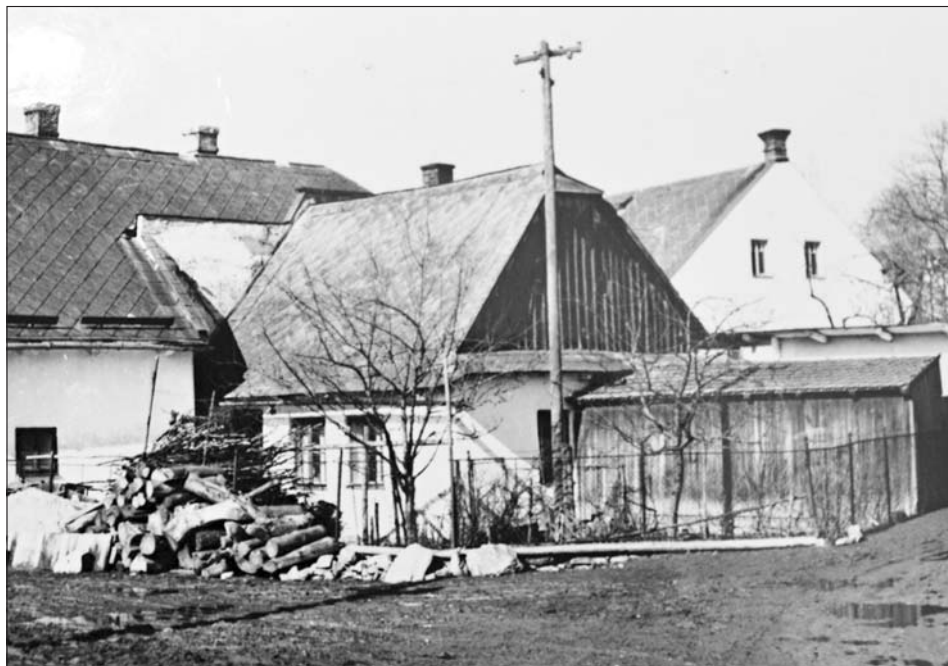
Domek Vincence a Klárky Federsellových na dolním podměstí (čp. 165)