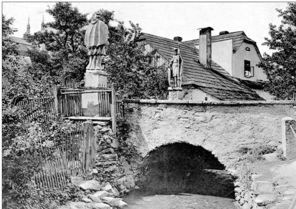
Pohled na domek Federsellových přes kamenný mostek se sochami sv. Václava a sv. Jana Nepomuckého